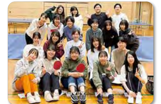
▲リフレッシュ研修