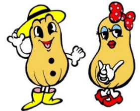
ピーちゃん ナッチちゃん