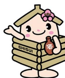
井戸っこ (しすいちゃん)