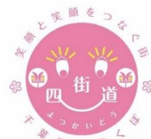
笑顔と笑顔 をつなぐ街