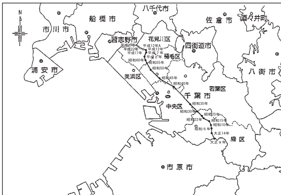
人口重心の移動（大正9年～平成27年）